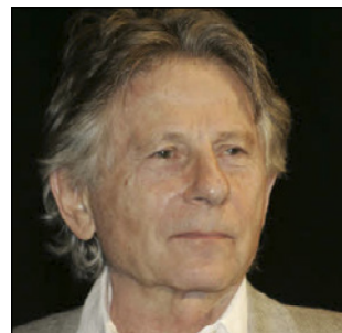
Roman Polanski, director

Interpretació: Emmanuelle Seigner (Vanda), Mathieu Amalric (Thomas).