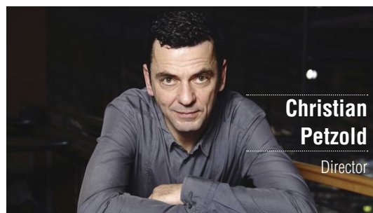
Christian Petzold Director