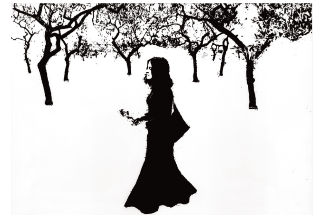
JOSEP M. RIBAS PROUS / FONDS D'ART CdL

Els actes marcats amb el logo també es podran seguir en directe pel canal Youtube del Centre de Lectura Ús obligatori de la mascareta Aforament limitat