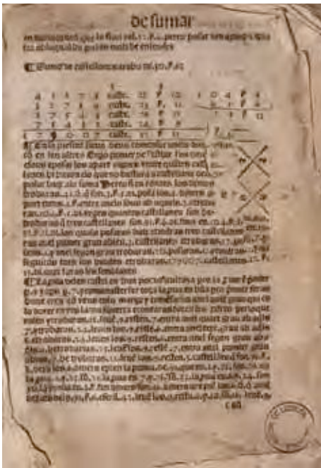
Joan Ventallol, [Practica mercantiuol], Lyo, mestre Joan de La Place, 1591.