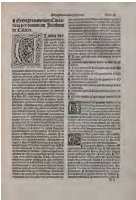
Jaume Callis, Extravagatorium curiarum , Barcelona, Petrum Posa, 1518 (foli II).

Cal destacar que entre la presidència de Serra i la de Joaquim Batet (1904-1905) es publicaren els setanta-nou números de la segona època de la Revista del Centro de Lectura (1-III-1901 a 15-IX-1904), publicació adscrita al modernisme literari i polític en la qual col·laborava la nova generació cultural local. Aquest òrgan assabentava sobre incorporacions bibliogràfiques i en feia indexacions ocasionals. 41