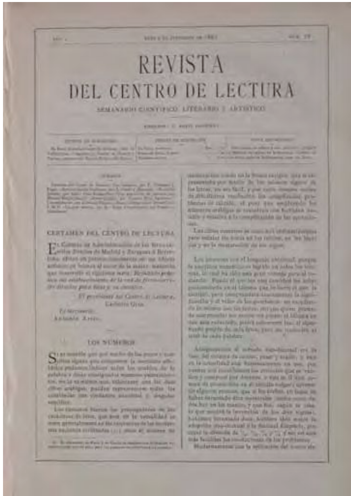
Primera etapa de la Revista del Centro de Lectura (1883-1884).

temporáneo en Cataluña, Baleares y Valencia (junta del 24-IX-1880). Per a l'actualització de tècniques industrials el Centre rebia La Gaceta de la Industria y de las invenciones , dirigida per l'enginyer Ventura Serra (l' Eco , 30-I-1881).