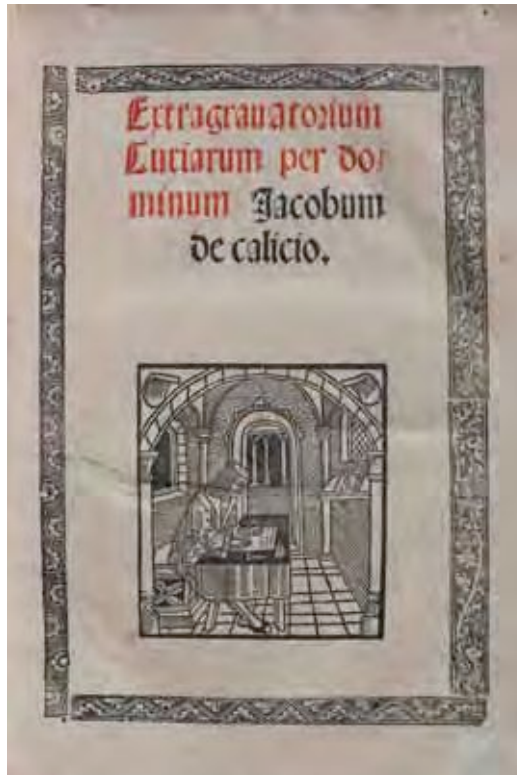
Jaume Callis, Extragravatorium curiarum , Barcelona, Petrum Posa, 1518 (portada).

L'adquisició del primer número de la revista quinzenal La Renaixensa fou una altra adquisició, dins les publicacions literàries, del curs 1870, segons anunciava l' Eco del Centro de Lectura del 12 de fe-