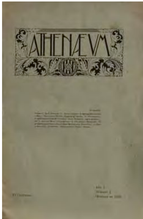
Athenaeum , revista del Centre de Lectura (1910-1911).

Pel que feia a diaris s'aprovà la subscripció al diari tradicionalista, El Correo Catalan (junta, 29-X-1912) i es demanà per què no es renovava la subscripció a l' Heraldo de Aragón , «quin periòdic se llegeix bastant», i a El Pueblo , rotatiu dirigit pel polític republicà valencià Vicent Blasco Ibàñez (junta, 12-VIII-1913). En junta del 19 de setembre de 1913 s'acordà donar-se de baixa del diari de Tolosa de Llenguadoc, La Dépêche , i renovar la subscripció al diari anglès Daily Mail .