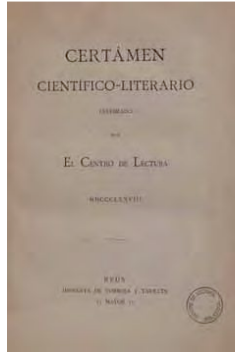
Volum que recull els treballs premiats del primer Certamen Científico-Literario organitzat pel Centre de Lectura.

La primera mesura adoptada per la nova presidència fou l'actualització de les classes a impartir per l'entitat. 29 També hom adquirí, segons aprovació de la junta del 28 de maig de 1887, «la preciosa obra» Autores dramáticos contemporáneos y joyas del Teatro Español . La Biblioteca registrà, dos mesos després, la subscripció del Diario Mercantil de Barcelona.