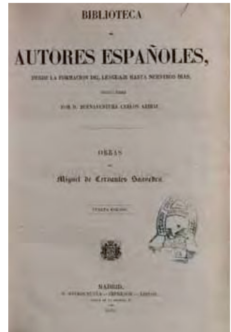
Col·lecció «Biblioteca de autores españoles» –amb el registre núm. 1– donada per Joan Prim i Prats (1860).

La presidència de Tomàs Lletget i Caylà estava essent positiva per a la consolidació de la lectura. Així, en la memòria que aquest llegí en la reunió general ordinària del 25 de maig de 1862, destacà