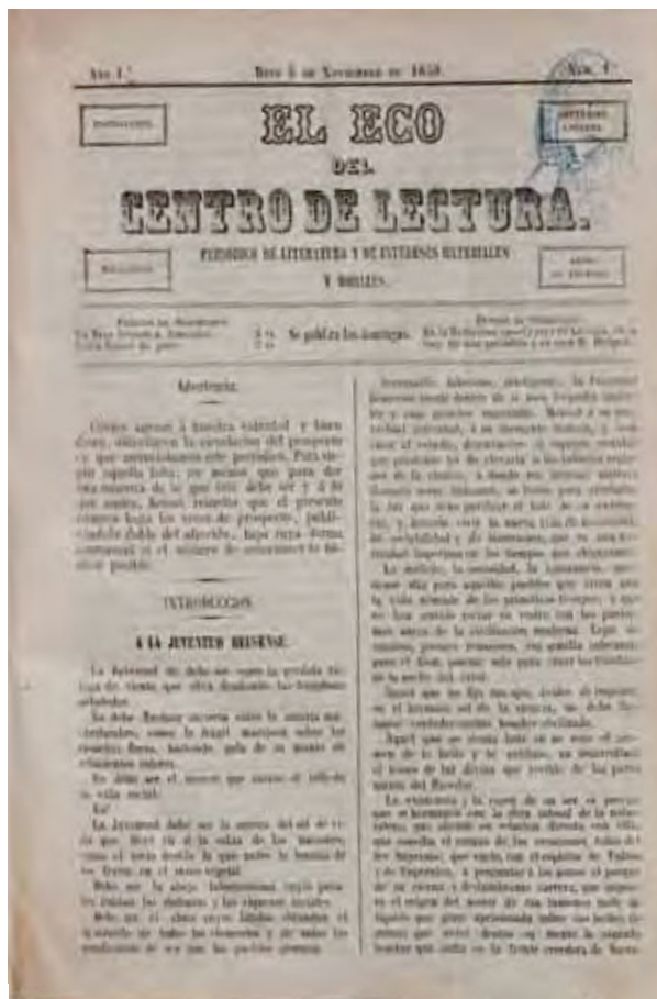
Primer número d' El Eco del Centro de Lectura , publicació de l'entitat (1859).