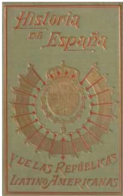
Alfredo Opiiso, Historia de España y de las repúblicas latinoamericanas , Barcelona, Gallach, [s.a.]. 15 v.

més d'integrar la dinàmica de la Biblioteca als cursos de l'entitat, en l'article 68 es projectava, per primer cop, a mode d'institucionalització social, una sala específica per a la col·lecció d'estudis locals, «debidamente ordenados y clasificados formando un Museo ó exposición permanente de Agricultura, Mineralogía, Indústria, Artes, tan necesario en esta comarca».