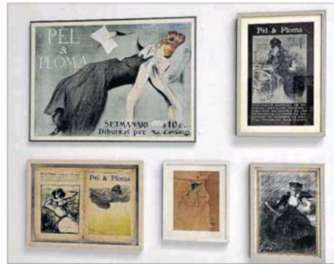
El pintor feia les il·lustracions de la publicació 'Pèl &amp; Ploma'.

REPORTATGE | La mostra es podrà visitar fins al pròxim 27 de novembre a la Sala Fortuny de l'entitat cultural