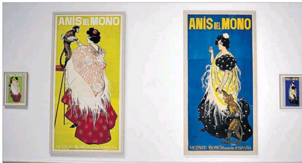
Ramon Casas va guanyar el concurs que va convocar l'empresa Anís del Mono per anunciar-se.

Influenciat per Toulouse-Lautrec (els francesos van ser els precursors del nou art del carrer), es va especialitzar en els cartells