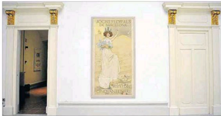
Cartell publicitari de les festes del cinquantenari dels Jocs Florals de Barcelona (1908).