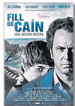
Caràtula del film.

El curs, reconegut com a activitat de formació permanent del Departament d'Ensenyament de la Generalitat, ha tingut força acceptació entre els professionals