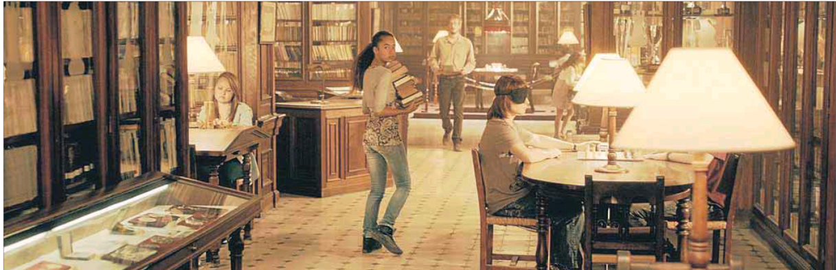
Un moment del rodatge d'algunes de les escenes de la pel·lícula.